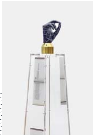
Aleksandra Domanović, Untitled, 2015 In ihren Arbeiten reflektiert Aleksandra Domanović Technologien, die unsere Körper nachhaltig verändert haben und denkt über mögliche Weiterentwicklungen nach. Sie sucht dafür in der Technologiegeschichte nach Beispielen insbesondere aus dem nicht-westlichen Raum und von Visionärinnen und Forscherinnen.

Mit passenden „Ersatzteilen“ fällt der wesentliche Grund für den Tod, das Versagen von Körperorganen, weg. Wie sich diese technischen Optimierungen auf das Zusammenleben auswirken, erkunden Science-Fiction Autor*innen in ihren Werken. Die Frage nach Unsterblichkeit ist bis heute Gegenstand gesellschaftlicher Debatten.