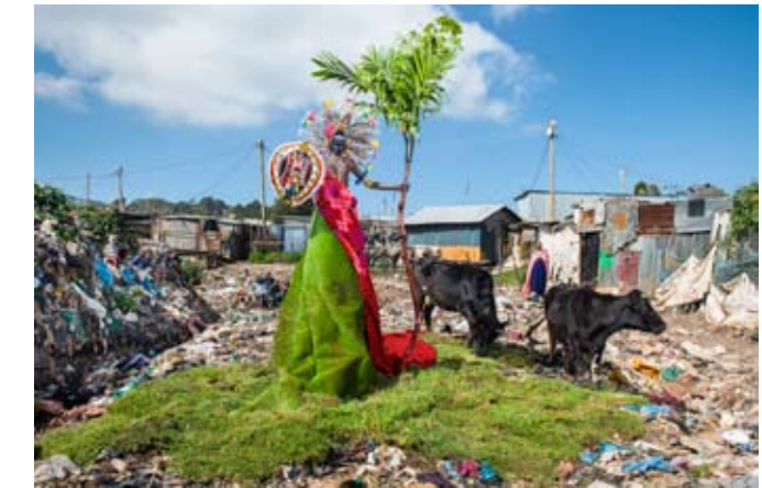
Fabrice Monteiro, Untitled #12, The Prophecy

Ein Prolog zu utopischem Denken stimmt auf die Ausstellung ein und im Epilog werden persönliche utopische Szenarien interaktiv angeregt. Schließlich bieten internationale künstlerische Positionen einen sinnlichen Zugang und die Möglichkeit zum Spekulieren: Was wäre, wenn...?