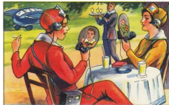
Frauen genießen ihren Drink im Grünen, während sie mit Handgeräten mit ihren Familien plaudern. Quelle: Sammelbildchen Zukunftsfantasiën aus dem Echte Wagner Album Nr. 3 von 1930.

Ab Mitte des 20. Jahrhundert wird das Telefon in Europa alltäglich und durch die Erfindung des Bild- und Mobiltelefons perfektioniert. Mit der Verbreitung des Internets scheint die letzte Hürde der Verständigung überwunden und das globale Dorf geboren: Utopisten träumen von frei zugänglichen Informationen für alle, ohne Sprachbarrieren, Falschinformationen oder politische Zensur. Ihre Träume sind bis heute aktuell.