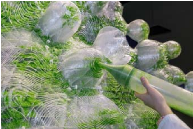
ecoLogicStudio, HORTUS XL Asthaxantin.g, bio-digital detail of the inoculation ecoLogicStudio ist auf urbanes Umweltdesign und die Einbringung von Natur- flächen in Gebäudeplanung spezialisiert.

Back to Future Technikvisionen zwischen Fiktion und Realität