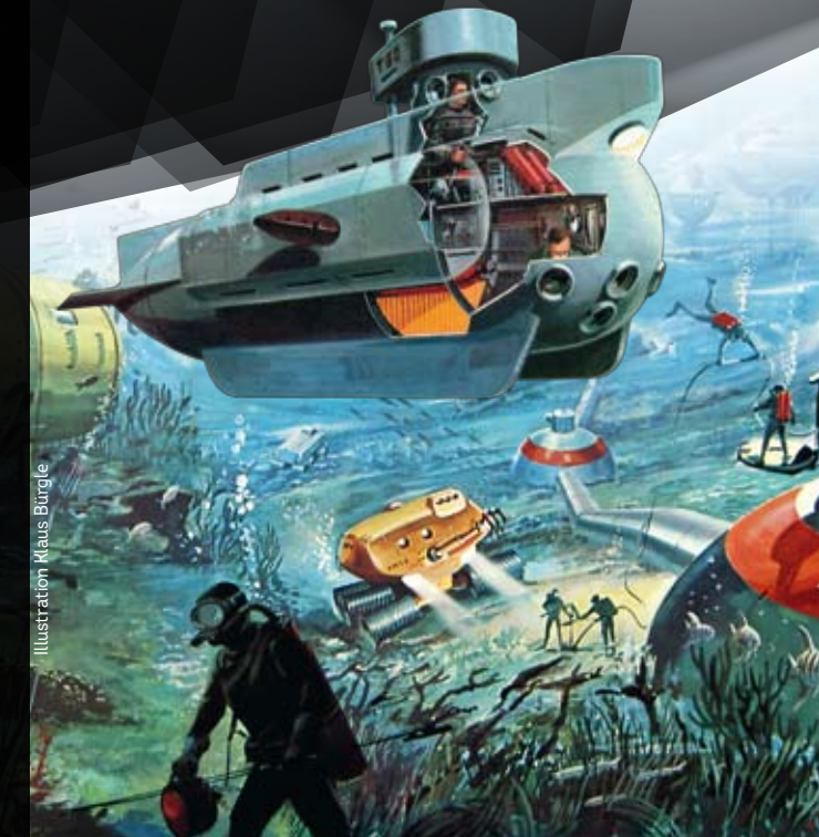
Illustration Klaus Bürge

TECHNIKVISIONEN ZWISCHEN FIKTION UND REALITÄT 18. NOVEMBER 2020 BIS 29. AUGUST 2021