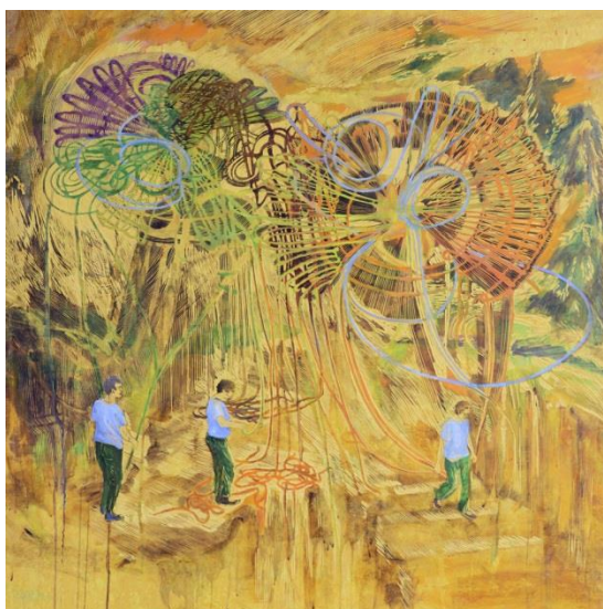
05_ Sabine Ostermann Schnittmenge, 2017 Linoleum Alkydfarbe 114 x 114 cm