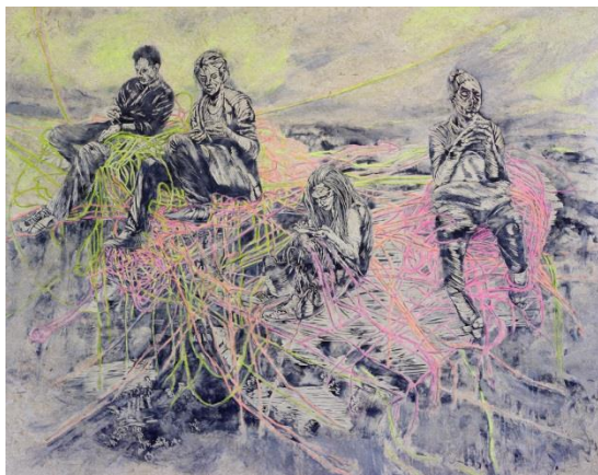
04_ Sabine Ostermann Quasselstrippen, 2016 Linoleum Alkydfarbe 180 x 227 cm