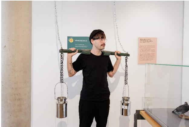
Joch für Menschen 20. Jh.