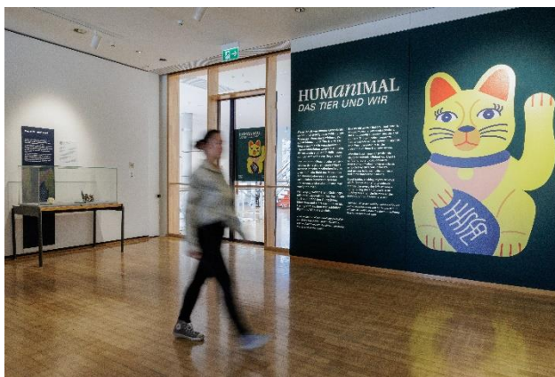
Humanimal. Das Tier und Wir Eingang der Ausstellung