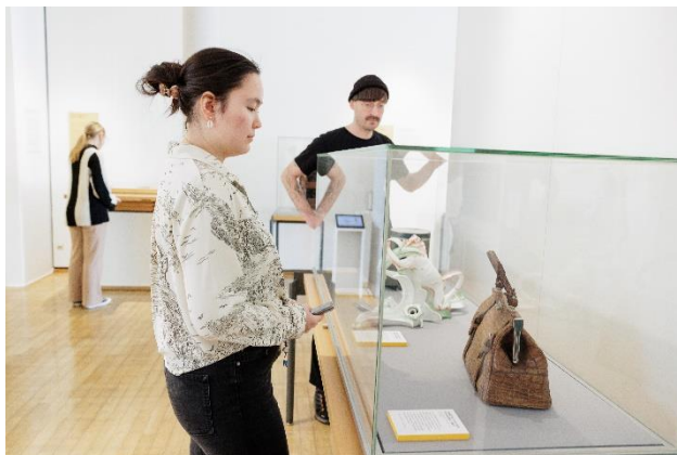
Tierhaut als Prestigeobjekt: Eine Handtasche aus Krokodilleder der Firma Goldpfeil.