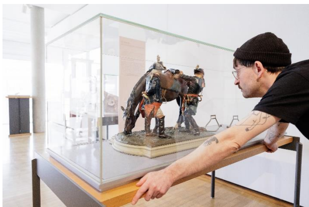
Plastik „Preußischer Feldpostmeister und Kurier um 1740“ Curt Tausch, um 1939, Museumsstiftung für Post und Telekommunikation