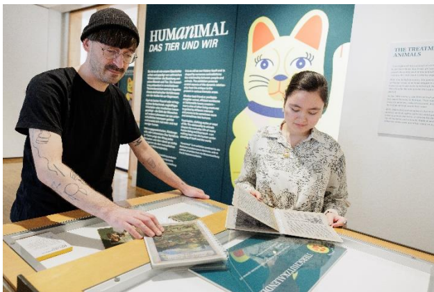
Tierschutzkalender zum Umblättern in der Ausstellung