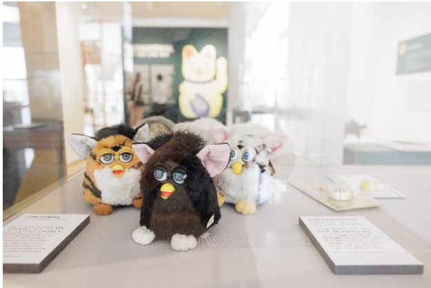
Furbys, Hasbro, Tiger Electronics Ltd., 1998–2000