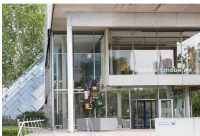
10_Der Pre Bell Man auf seinem gewohnten Platz

Alle Abbildungen sind unter www.mfk-frankfurt.de/pressemappen verfügbar. Ein Abdruck der Pressefotos ist kostenfrei und nur im Rahmen der Berichterstattung über die Ausstellung „Die Rückkehr des Pre Bell Man. Nam June Paik und zeitgenössische Medienkunst aus der Sammlung von Kelterborn“ im Museum für Kommunikation Frankfurt gestattet.